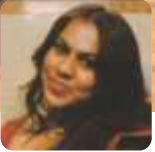
Schanna Muliyl St. Kuriakose Elias Chavara Church, Kandivali East