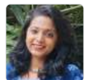
Sophia Cyril St. Bartholomew Church, Kalyan (E)