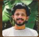
Ajith Vincent Kristuraj Church, Marol

A t the start of a relationship, everything feels light, easy, and exciting. You talk for hours, share memes, dream about the future, and it all feels perfect. But as time passes, that lightness sometimes turns into pressure — the kind that quietly weighs you down.